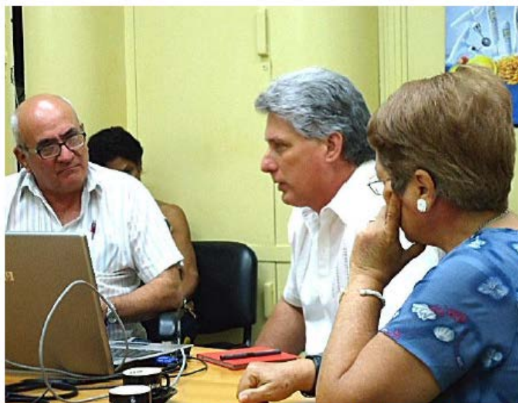
Fig. 5. Visita al INIMET de Miguel Díaz-Canel, Primer Vicepresidente del Consejo de Estado y de Ministros, en noviembre de 2012.

La actividad científica del INIMET ha aportado dos premios provinciales de innovación tecnológica y un premio nacional. Los aportes a la economía han sido premiados hasta el nivel nacional por el Movimiento del Fórum de Ciencia y Técnica, y la Asociación Cubana de Economistas y Contadores (ANEC).